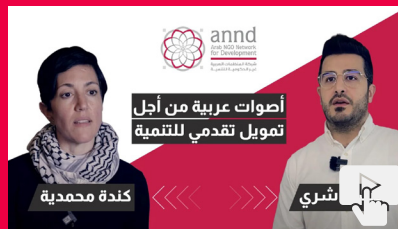
أصوات عربية من أجل تمويل تقديمي للتنمية اجتماع استشاري