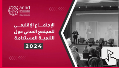
الاجتماع الإقليمي للمجتمع المدني حول التنمية المستدامة 2024