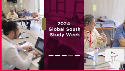
Global South Study Week 2024