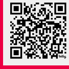
Jordanian Civil Society's Efficacy Is Met with More Restrictions