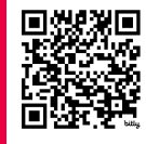
Gender Equality in Yemen