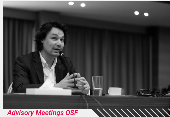
Advisory Meetings OSF