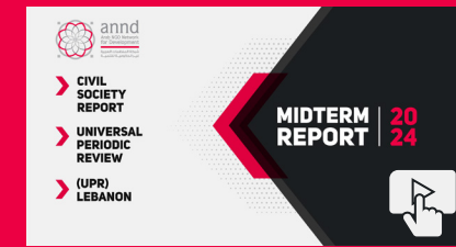
UPR Lebanon 2024 - Midterm Report / تقرير منتصف المدة ضمن آلية الاستعراض الدوري الشامل