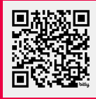
Rapport Alternatif de la Société Civile sur Les Objectifs de Développement Durable en Mauritanie 2024