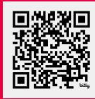
تقرير تسليط الضوء على التقرير الوطني الطوعي حول التقدم في إحراز أهداف التنمية المستدامة في اليمن - 2024