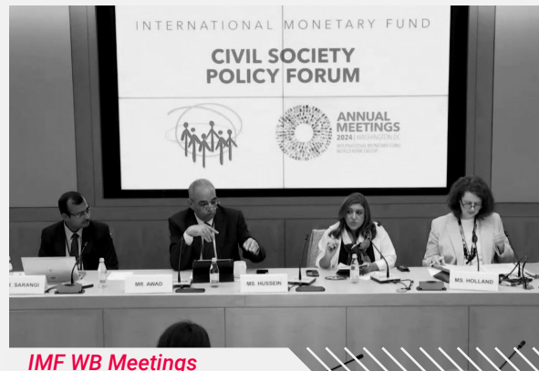
IMF WB Meetings