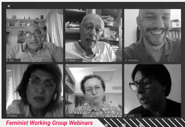
Feminist Working Group Webinars