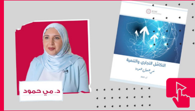
التكامل التجاري والتنمية في الدول العربية