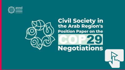
آخر المستجدات من مؤتمر الأطراف التاسع والعشرين في باكوا