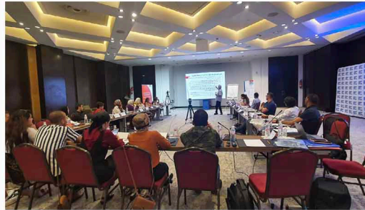
المدرسة الصيفية الإقليمية حول الحماية الاجتماعية