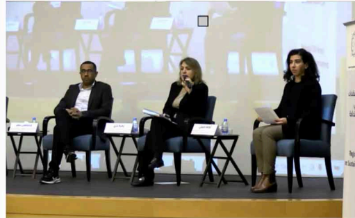
الاجتماع الإقليمي لمنظمات المجتمع المدني حول التنمية المستدامة