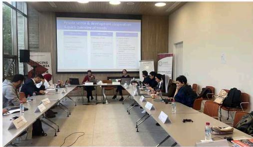
الأسبوع الدراسي 2022 حول سياسات الاقتصاد الكلي والتجارة والاستثمار والتنمية