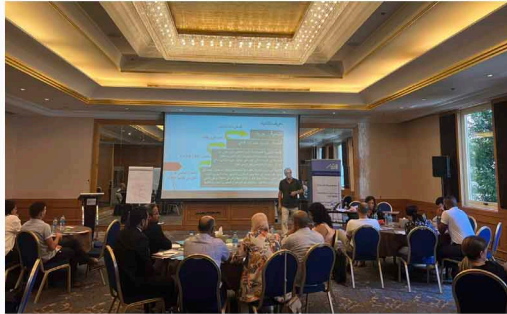
منتدى الشباب ضمن مشروع سفير