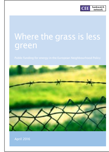
الاتحاد الاوروبي والطاقة في العالم العربي