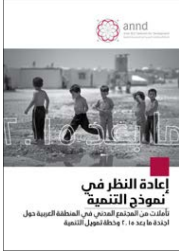
إعادة النظر في نموذج التنمية ما بعد ٢٠١٥