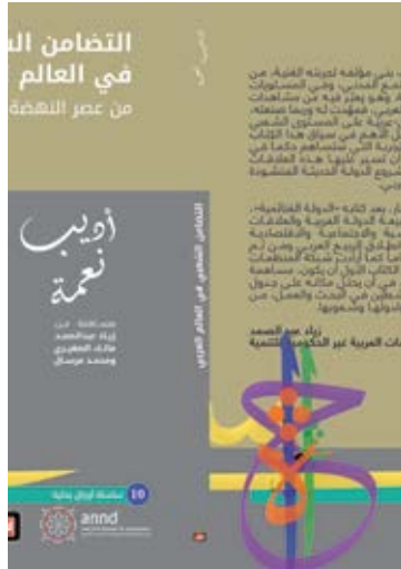
التضامن الشعبي في العالم العربي: من عصر النهضة الى الربيع العربي