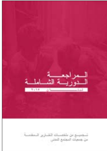
المراجعة الدولية الشاملة لبنان ٢٠١٥